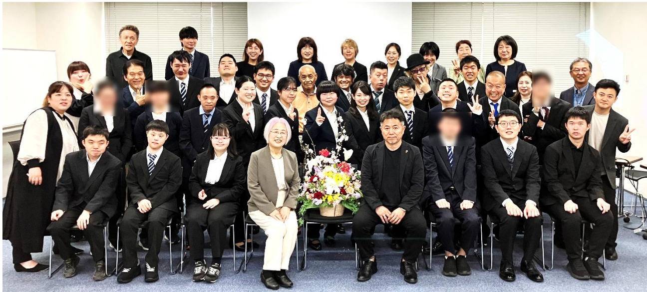
入所式 刈谷市産業振興センターにて