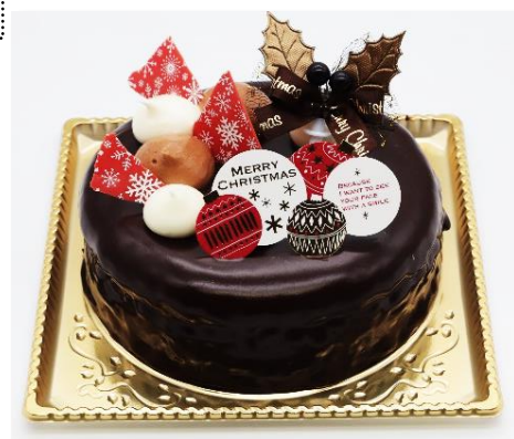
チョコプレミアム