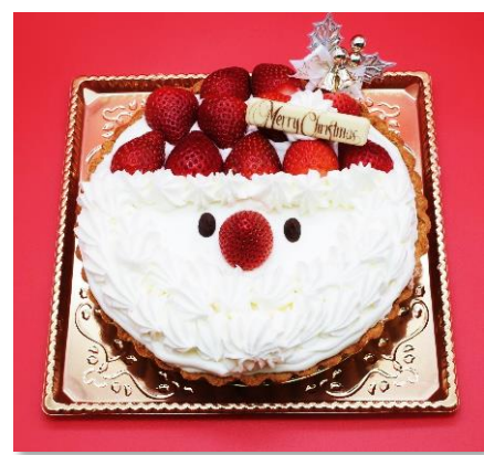
レアチーズタルト