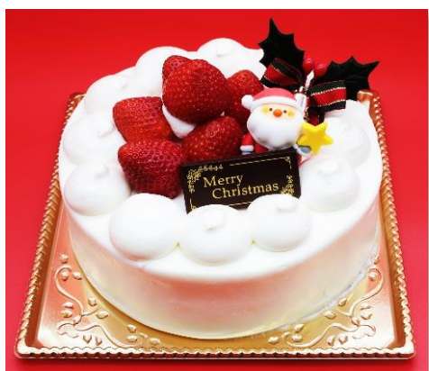
いちご生クリーム