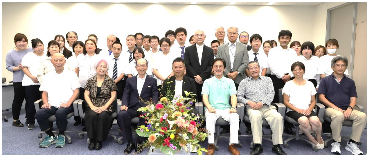
第25回 パンドラの会 定時総会